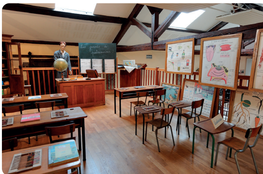
Salle de classe des années 1950.

En 1995, La Chapelle Saint-Luc décide d'immortaliser la mémoire chapelaine en créant un musée ouvert au public. Depuis juin 2000, celui-ci présente un patrimoine qui illustre le 20 e siècle grâce à des dons de familles chapelaines, d'entreprises ou d'amis de la ville.