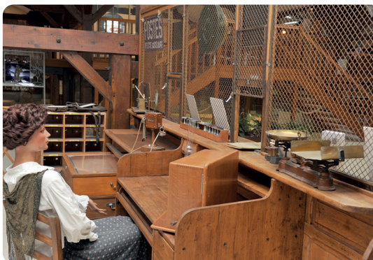
Bureau de poste des années 1930.