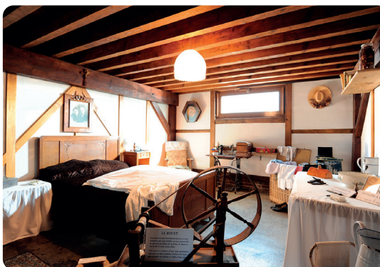
Logement de la première moitié du 20 e siècle.